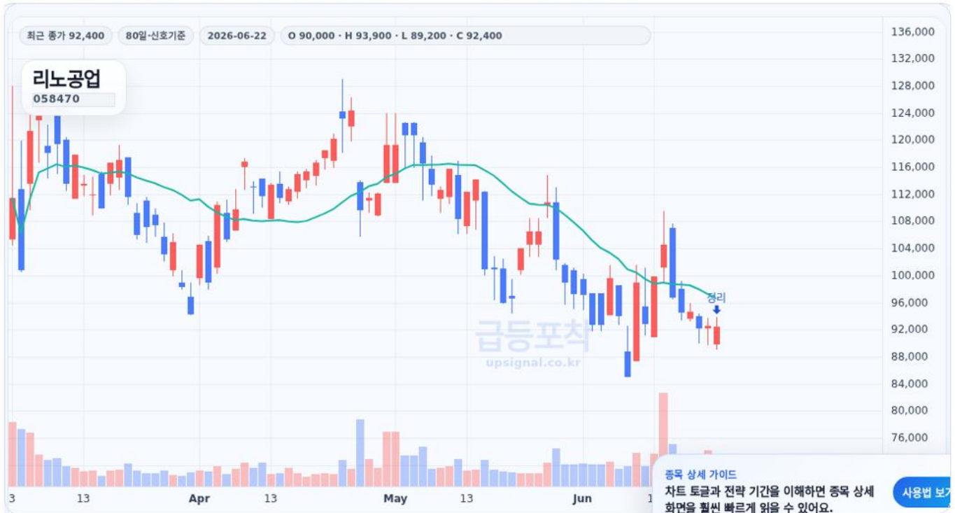
급등포착 종목상세 차트 캡처 기준

수익실현 점검 · 진입 88,600원 · 정리 92,400원 · 수익률 68.0% · 재진입 참고 88,600원