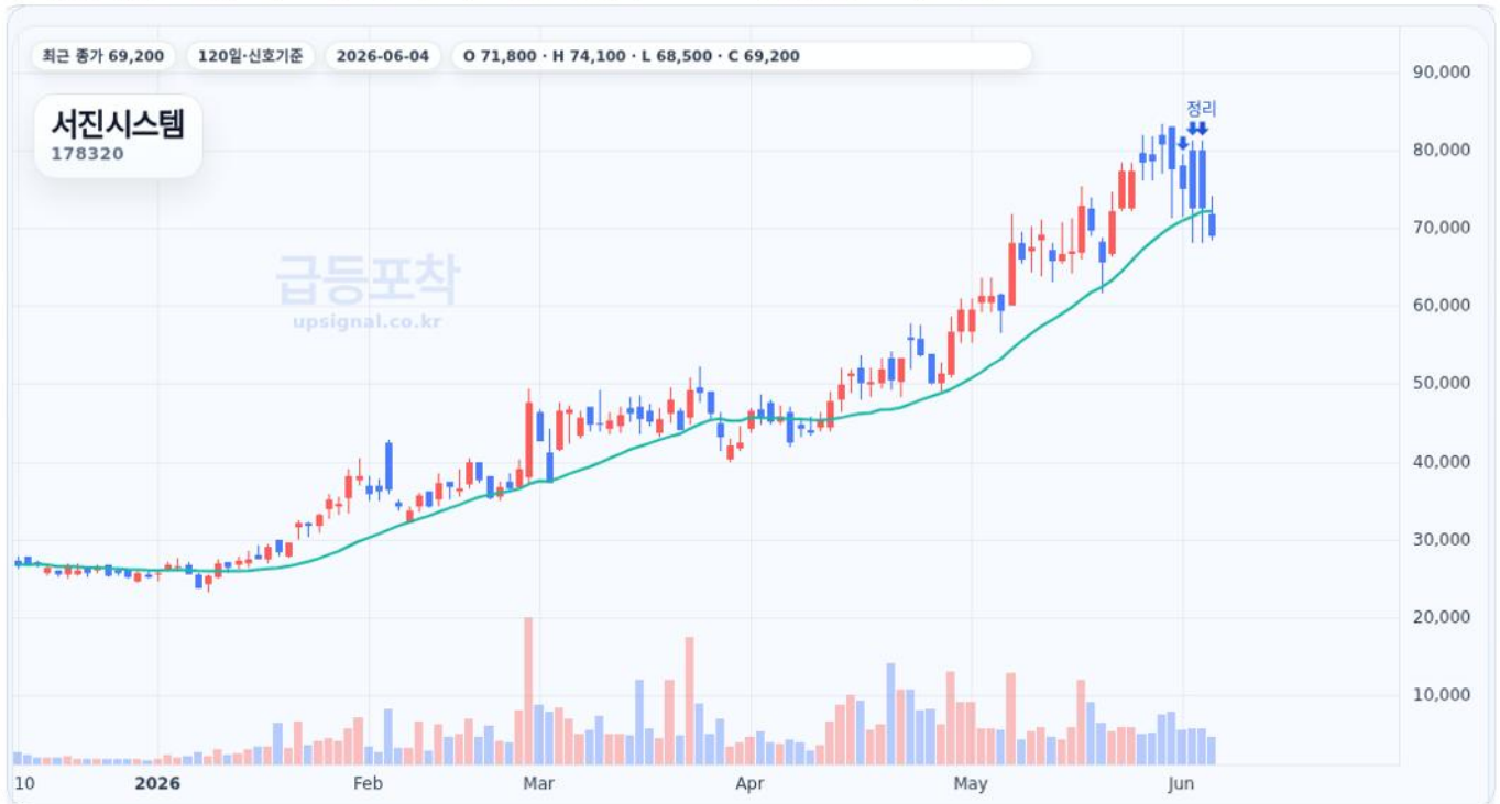
급등포착 종목상세 차트 캡처 기준

수익실현 점검 · 진입 68,200원 · 정리 72,600원 · 수익률 28.9% · 재진입 참고 68,200원