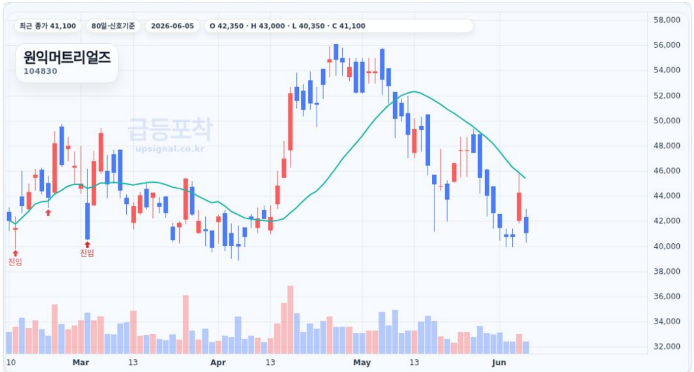
급등포착 종목상세 차트 캡처 기준

수익실현 점검 · 진입 39,400원 · 정리 41,100원 · 수익률 54.6% · 재진입 참고 39,400원