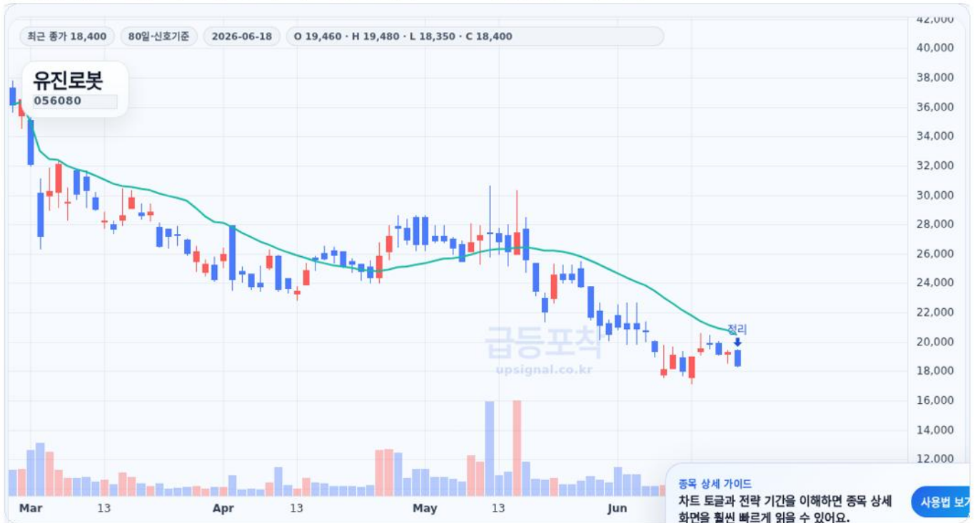
급등포착 종목상세 차트 캡처 기준

수익실현 점검 · 진입 17,510원 · 정리 18,400원 · 수익률 81.5% · 재진입 참고 17,510원