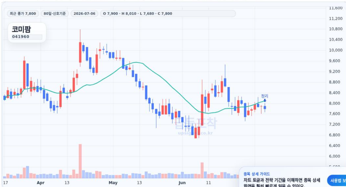
금융포착 종목상세 차트 캡처 기준

종합점수 34.4점, 현재가 7,800원, 진입 참고가 7,500원, 목표 참고가 8,990원, 위험 관리 기준 6,670원