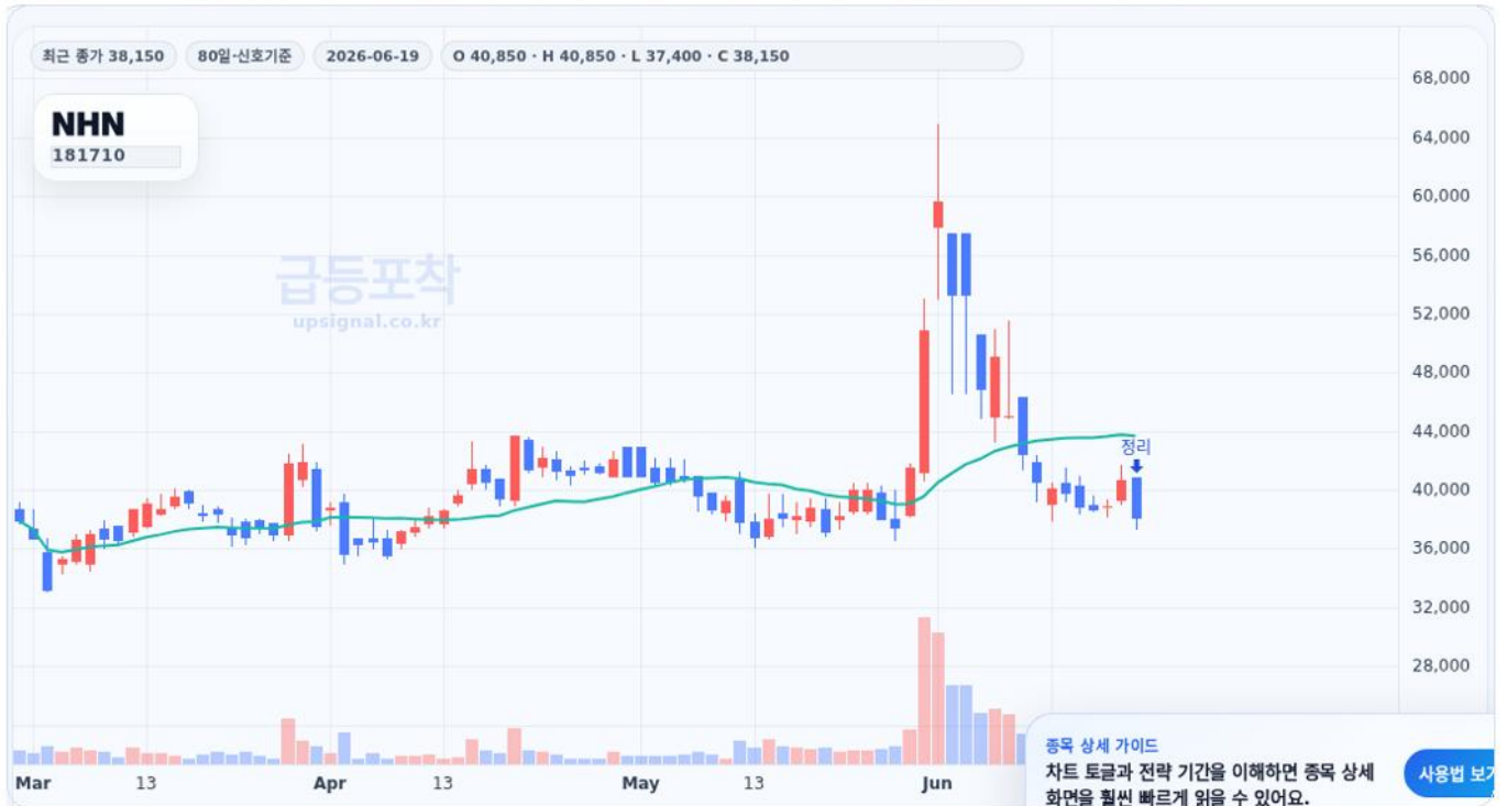
급등포착 종목상세 차트 캡처 기준

종합점수 30.23점, 현재가 38,150원, 진입 참고가 36,850원, 목표 참고가 44,150원, 위험 관리 기준 32,750원