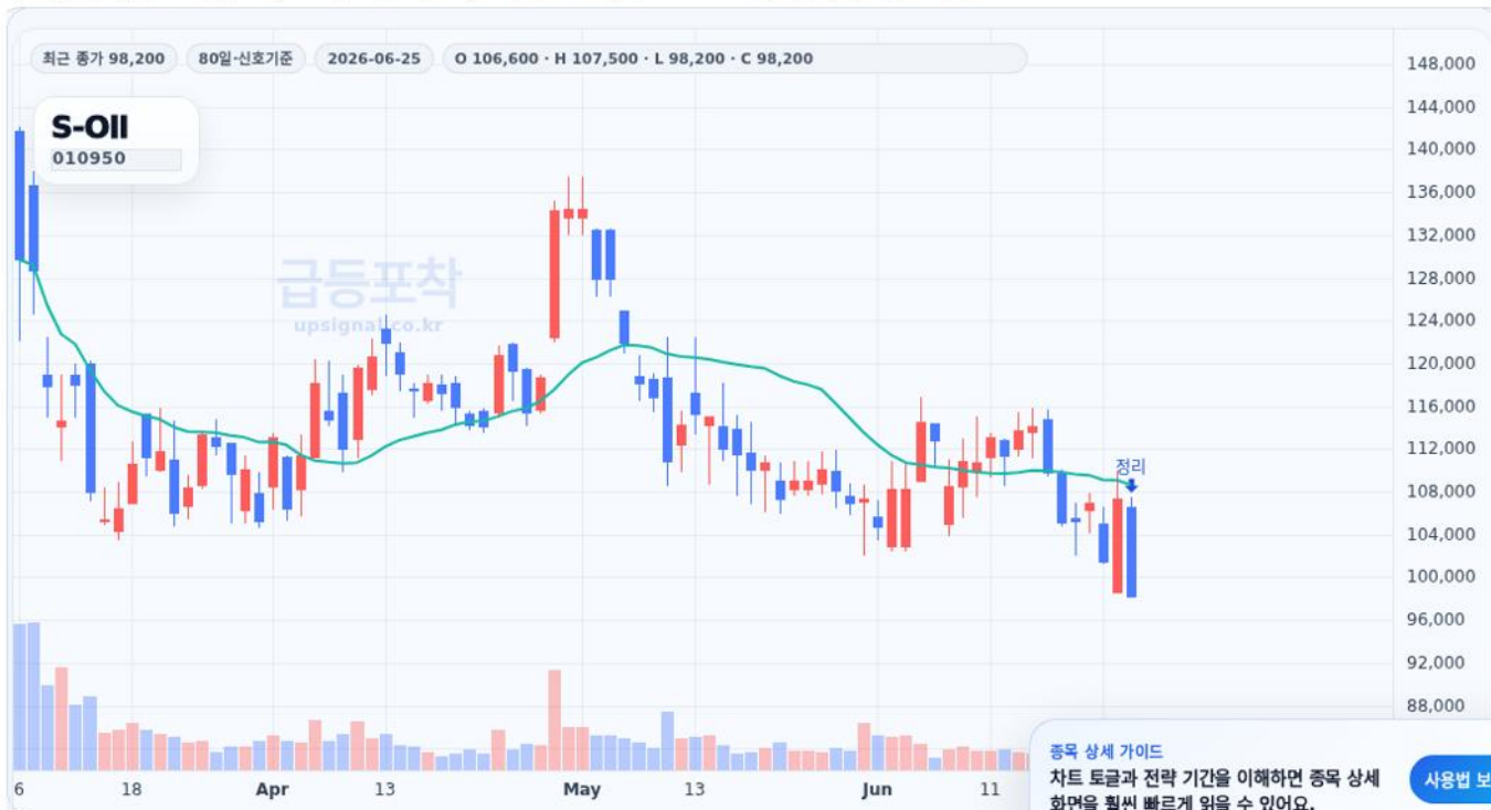
급등포착 종목상세 차트 캡처 기준

수익실현 점검 · 진입 94,800원 · 정리 98,200원 · 수익률 34.8% · 위험 관리 84,300원