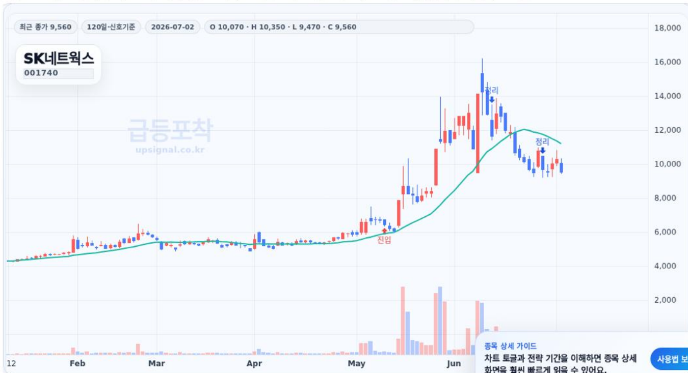
급등포착 종목상세 차트 캡처 기준

점수 54.2점 · 현재가 9,560원 · 진입 참고가 8,600원 · 목표 참고가 12,010원 · 위험 관리 기준 7,050원